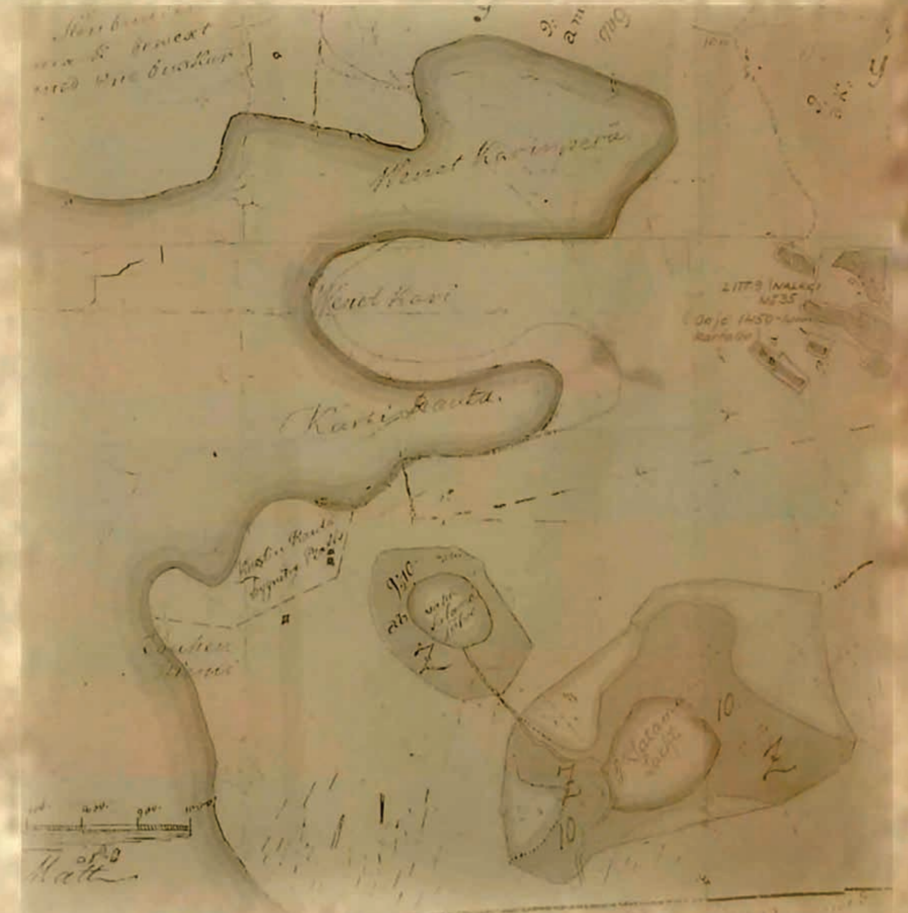
Sataman lahti näkyy vuoden 1760 kartassa vesialueena, joka muistuttaa järveä.